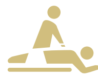
Spa & Peluquería