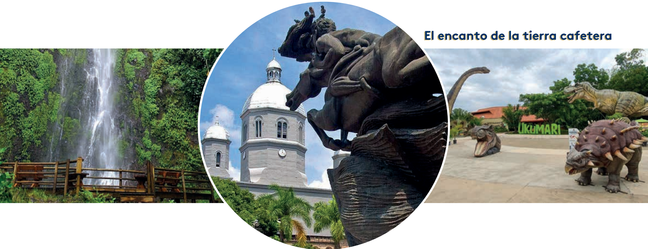
El encanto de la tierra cafetera

HERMOSOS PAISAJES , CON VERDES MONTAÑAS Y PARQUES NATURALES, con una excepcional DIVERSIDAD EN FAUNA Y FLORA, siendo así una ciudad con un enorme potencial económico, desarrollo en infraestructura y un ecosistema cada vez más robusto.